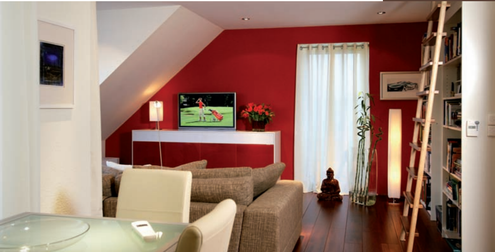
EIN BLICK IN DAS HAMBURGER SMARTHOME AN DER WAND DAS DESIGNER-SIDEBOARD VON UTZ