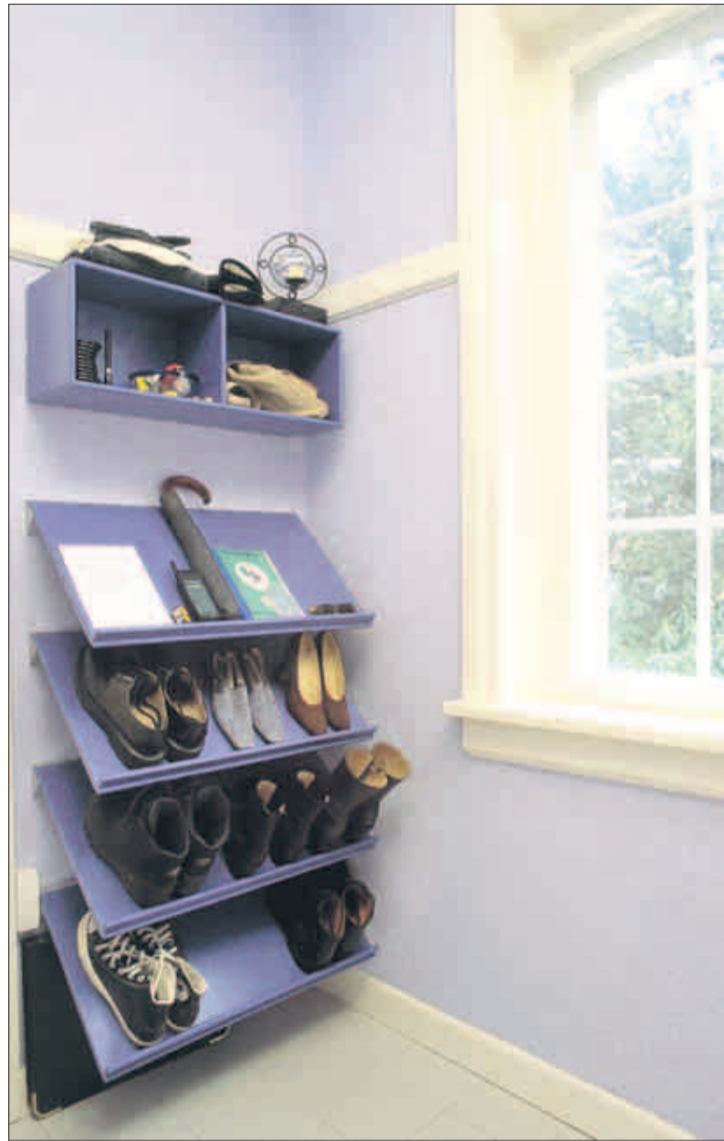
Offene Regalsysteme von Montana, hier eines zur Ablage von Schuhen und anderen Kleinigkeiten, passen sich selbst kleinen Nischen an.

Die Schiebetechnik richtet sich nach ästhetischen und funktionalen Gesichtspunkten. Im Ange-