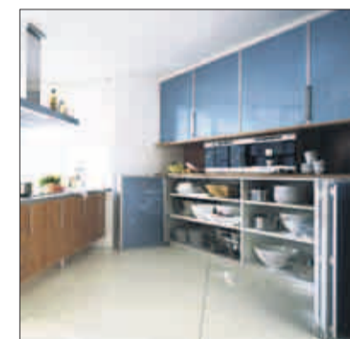
Schränktüren, die sich beim Öffnen falten lassen.

Übrigens, der „placard“ hat in Frankreich nicht nur Eingang in den Wohnbereich, sondern auch in die Sprache gefunden. „Avoir un cadavre dans le placard“ sagen die Franzosen, wenn jemand etwas Schlimmes zu verbergen hat. Was auf interkulturelle Unterschiede hindeutet: Hierzulande liegen die Leichen nämlich immer noch im Keller.